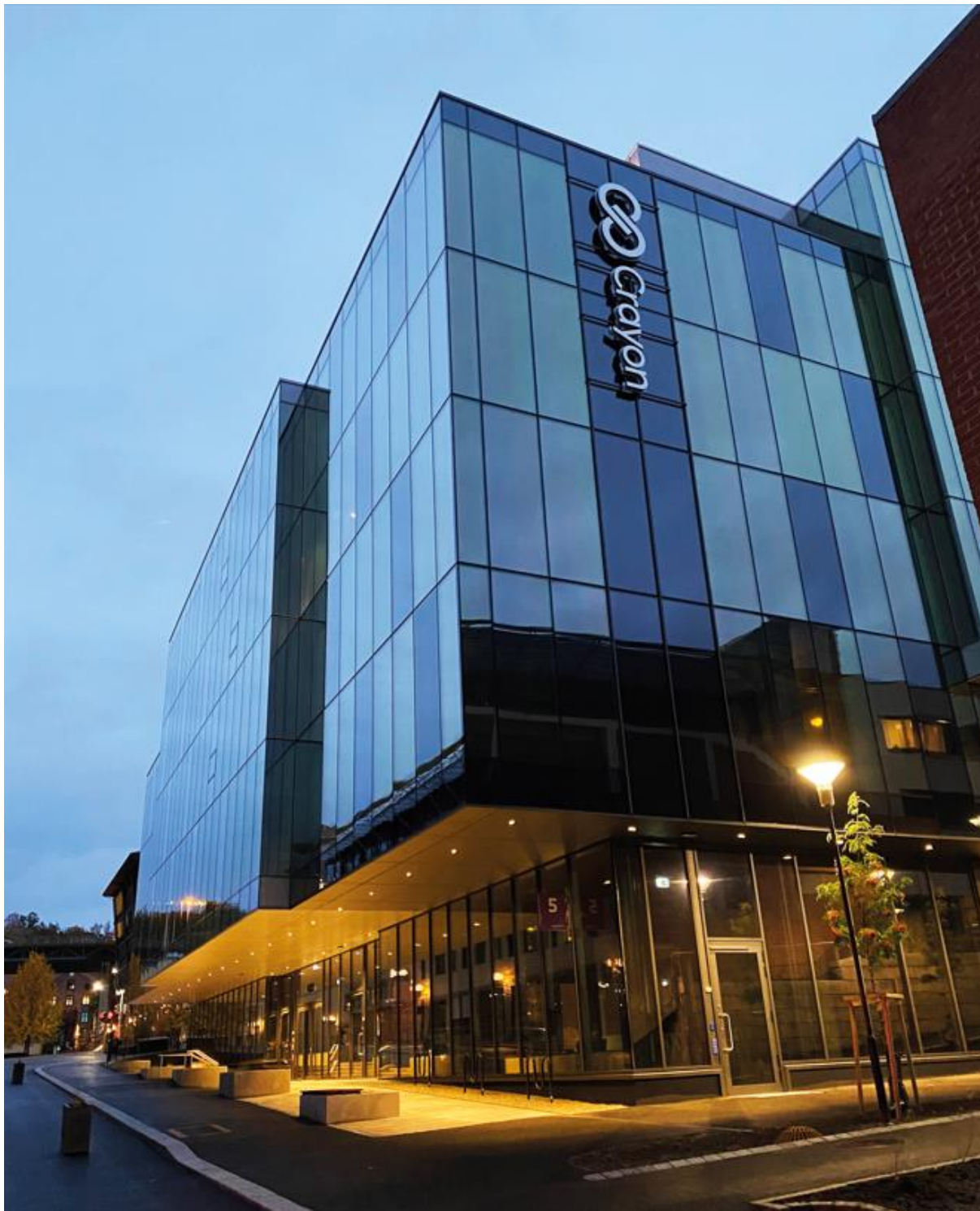
Gullhaug Torg 5, Oslo