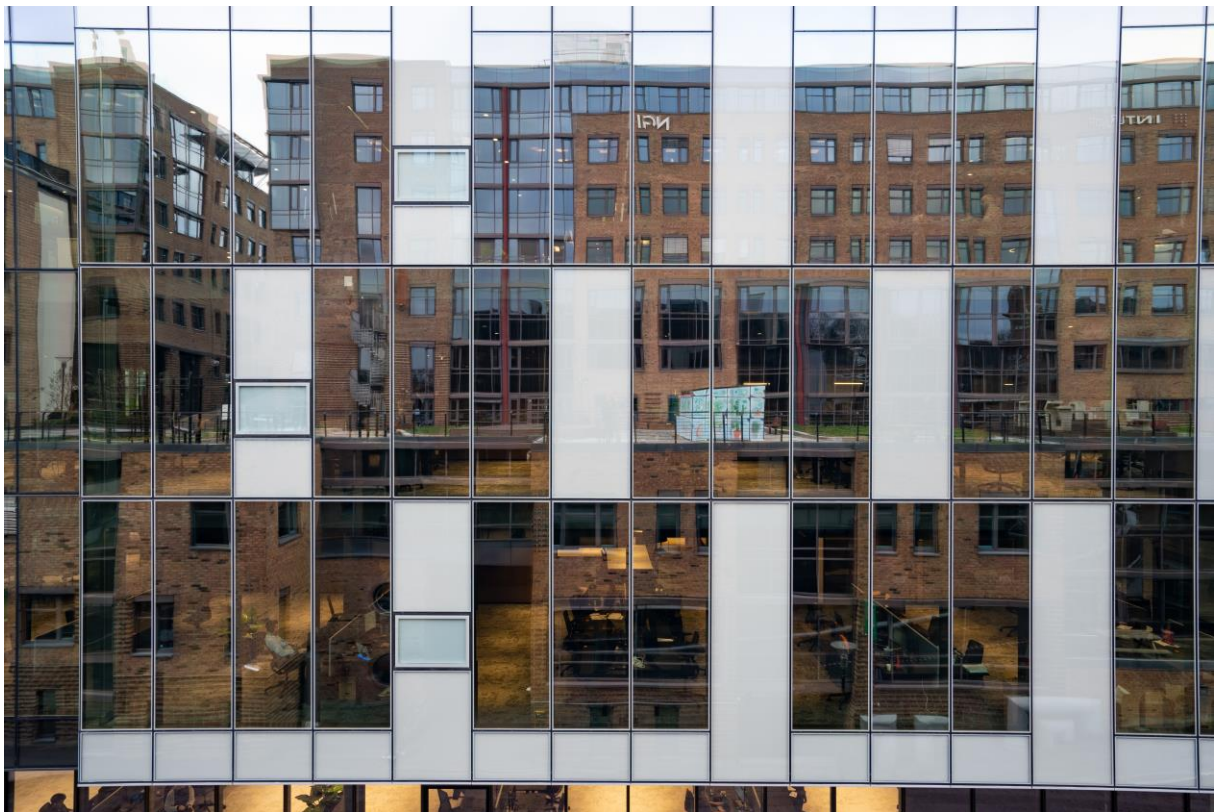
Gullhaug Torg 5, Oslo