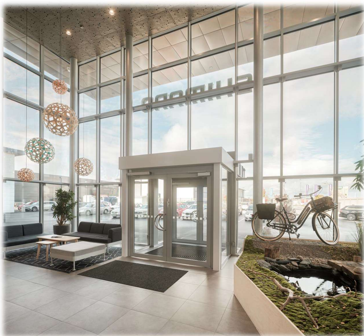
Interiörbild från Shimano Uppsala